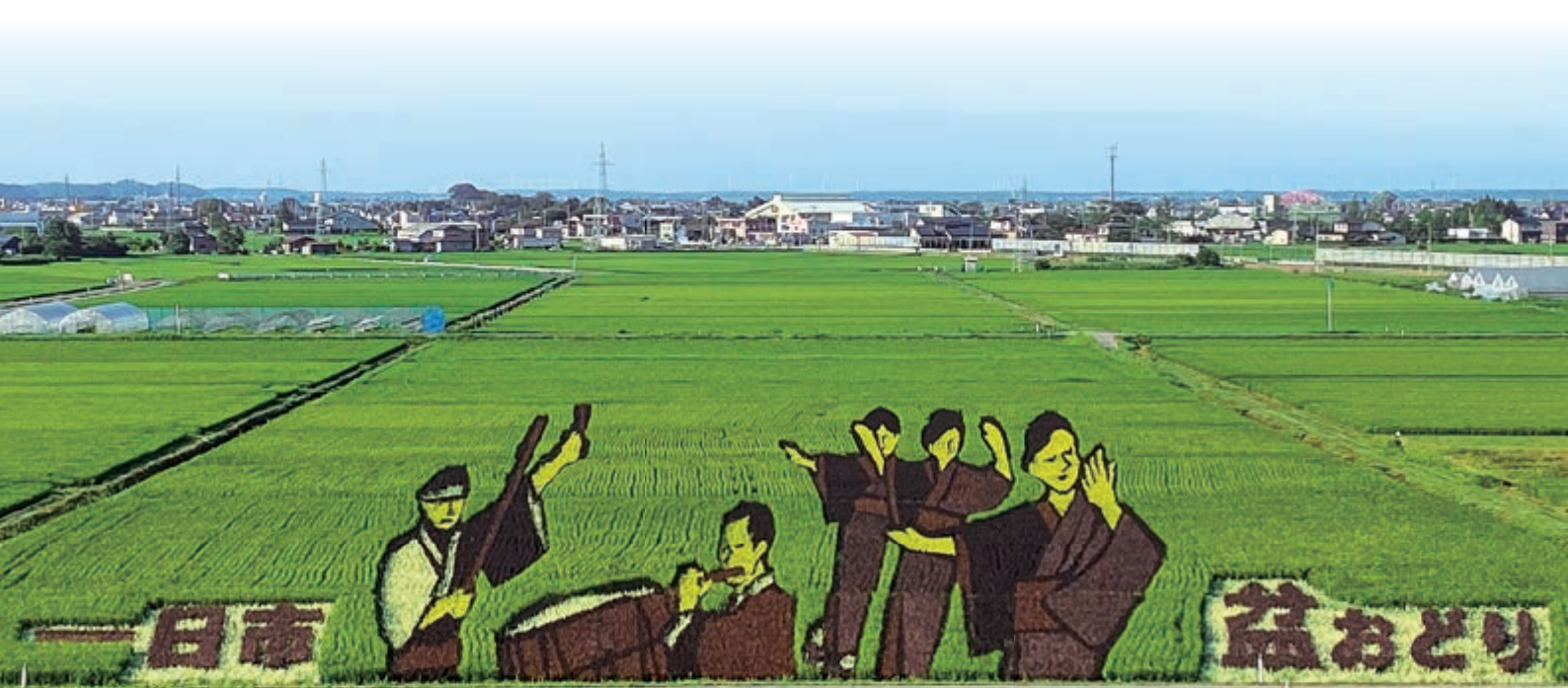
八郎潟町塞ノ神農村公園から見える田んぼアート